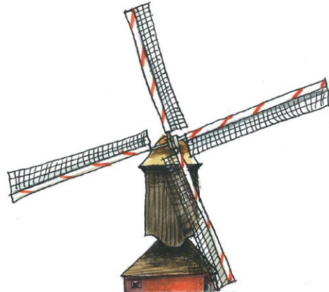
4 - Rouwstand

Leer molentiaal! Vroeger was er geen internet, gsm of televisie. Via de molen werden berichten doorgegeven. Dit gebeurde door de wieken in een bepaalde stand te zetten.