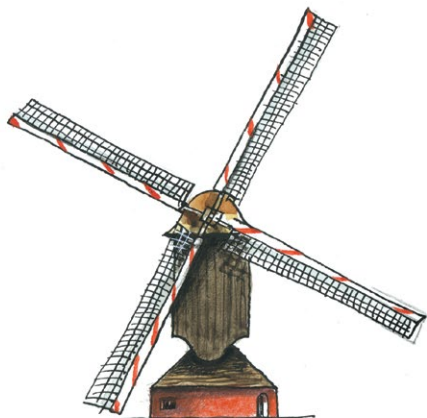
3 - Vreugdestand